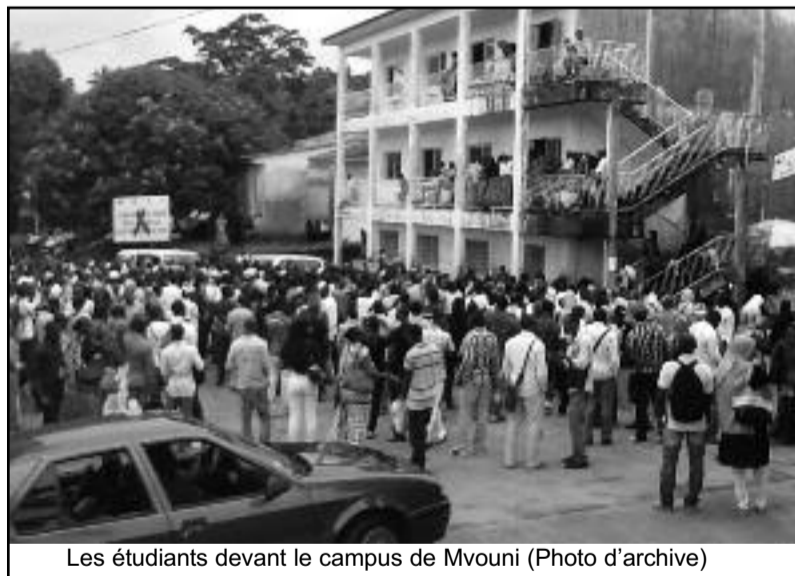
Les étudiants devant le campus de Mvuni

transport. Le minimum pour un étudiant. Bien que ces difficultés soient remontées jusqu'au gouvernement, elles n'ont jusqu'à lors aucune solution. Des étudiants continuent à faire leur besoin dans les champs avoisinants, et à s'asseoir à deux sur un seul siège et ils en parlent avec amertume. A défaut de la mise à disposition des chambres universitaires construites depuis plus de 5 ans, les étudiants venus de loin sont obligés de trouver refuge à Mkazi, Mvuni ou Moroni pour louer de petits studios. Mais là ce n'est pas la solution car les coûts ne sont pas à la portée de toutes les bourses. « Je fais ma troisième année