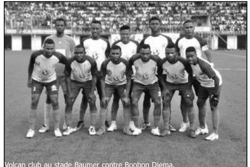
Volcan club au stade Baumer contre Bonbon Djema.