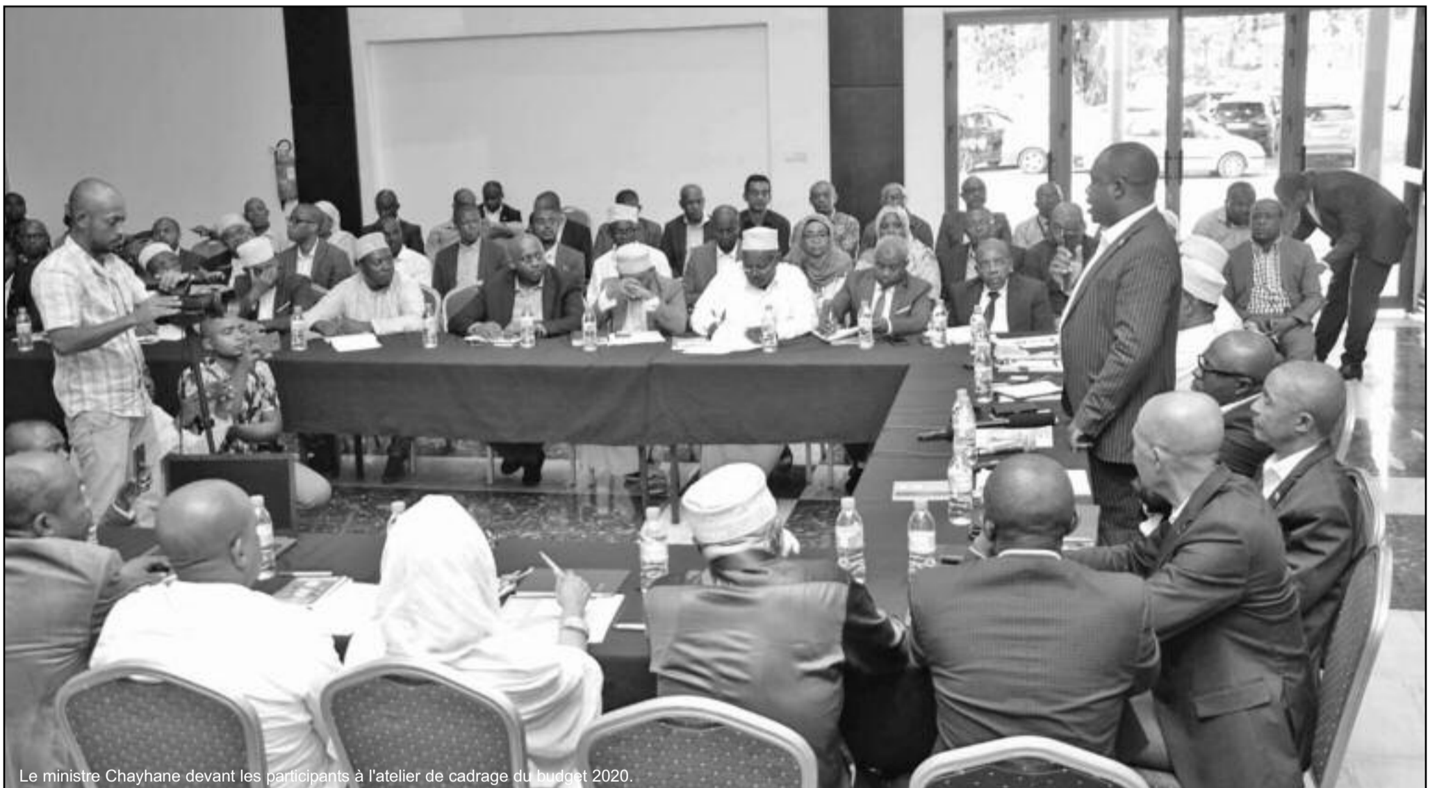
Le ministre Chayhane devant les participants à l'atelier de cadrage du budget 2020.

Pour présenter la loi des finances 2020, le ministre des Finances, du Budget et du Secteur bancaire a tenu un atelier de travail au Retaj. Une assise qui avait pour but de présenter les grandes lignes du budget de l'année 2019 en cours d'exécution. Une démarche qui s'inscrit dans le cadre de la préparation de la loi de finances 2020.