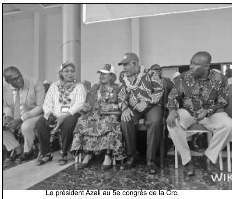
Le président Azali au 5e congrès de la Crc.

Serein, le président Azali Assoumani dit ne pas reconnaître le « CNT ». Selon lui et en se référant à un terme comorien, le Cnt « en langue nationale signifie une marmite à mendier ». Le président d'honneur de la Crc dit ne pas reconnaître le Cnt tout comme celui-ci ne reconnaît pas sa réélection, tout en faisant la nuance entre le Cnt et l'Opposition, il se dit ouvert au dialogue avec l'Union de l'Opposition et non le Cnt « pour construire ensemble le pays ».