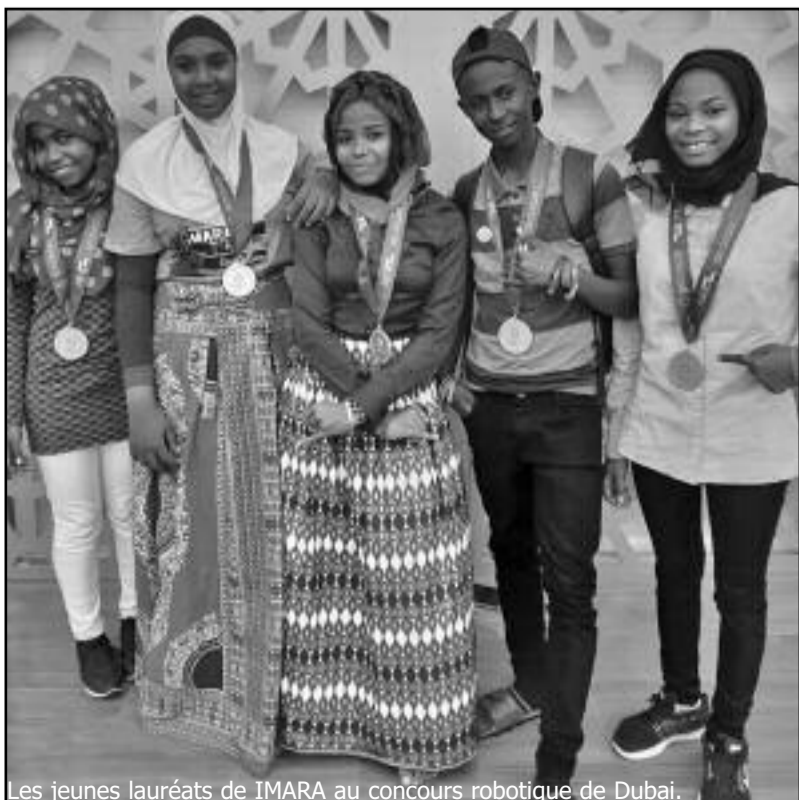
Les jeunes lauréats de IMARA au concours robotique de Dubaï.